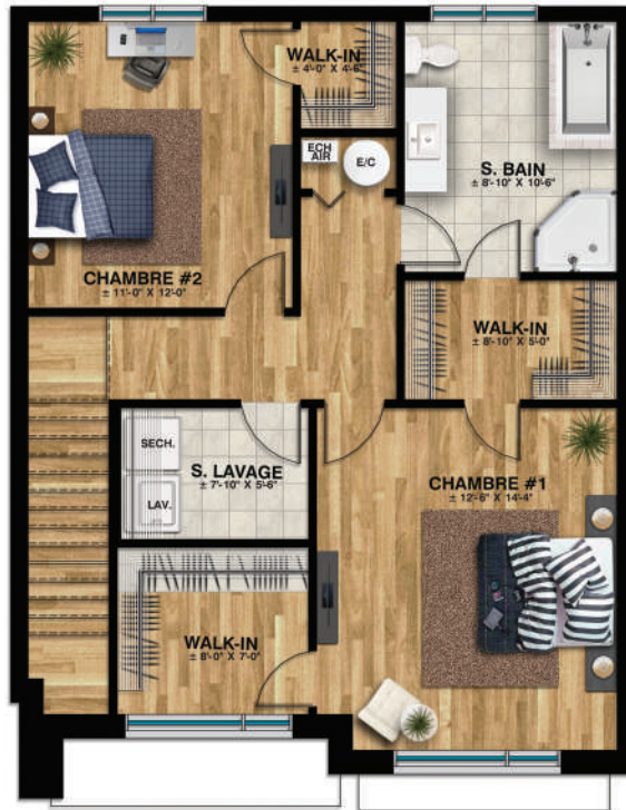
Étage - 2CH Sup. totale: ±791 pi.ca.

AMÉNAGEMENT PAYSAGER, GAZON, ASPHALTE ET ACCÈS À UNE PISCINE COMMUNAUTAIRE PRIVÉE ET CHAUFFÉE.