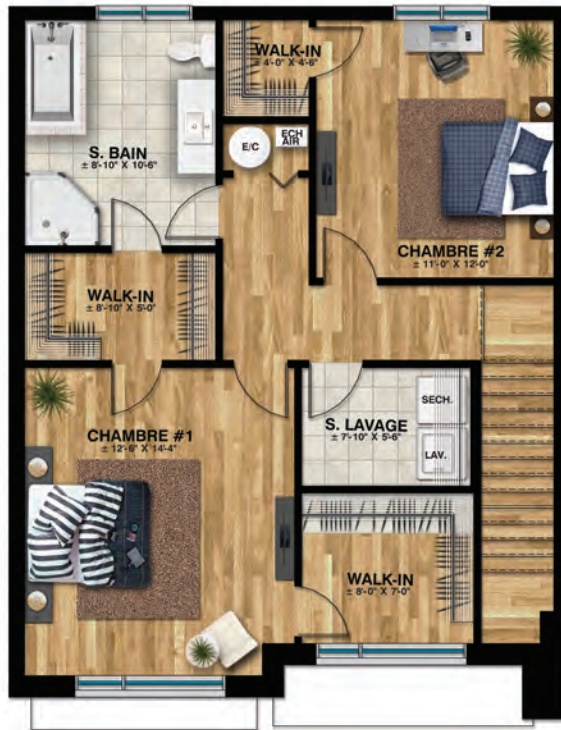
Étage - 2CH Sup. totale: ±791 pi.ca.