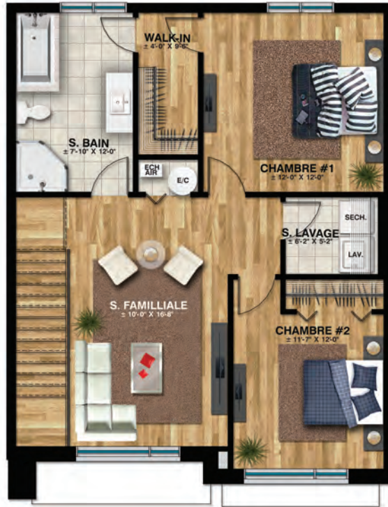
Étage - 2CH- MEZZANINE Sup. totale: ±791 pi.ca.

AMÉNAGEMENT PAYSAGER, GAZON, ASPHALTE ET ACCÈS À UNE PISCINE COMMUNAUTAIRE PRIVÉE ET CHAUFFÉE.