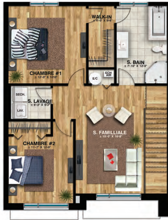
Étage - 2CH- MEZZANINE Sup. totale: ±791 pi.ca.

VERSION 2 CHAMBRES + MEZZANINE GARAGE À GAUCHE