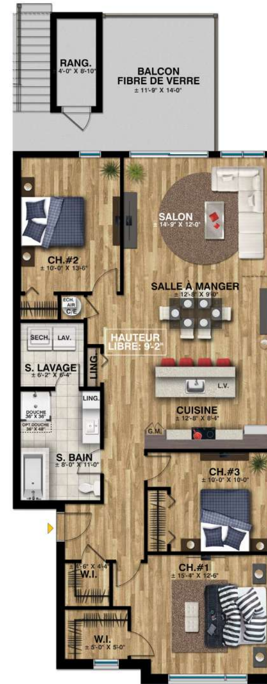
Logement 3 et 5