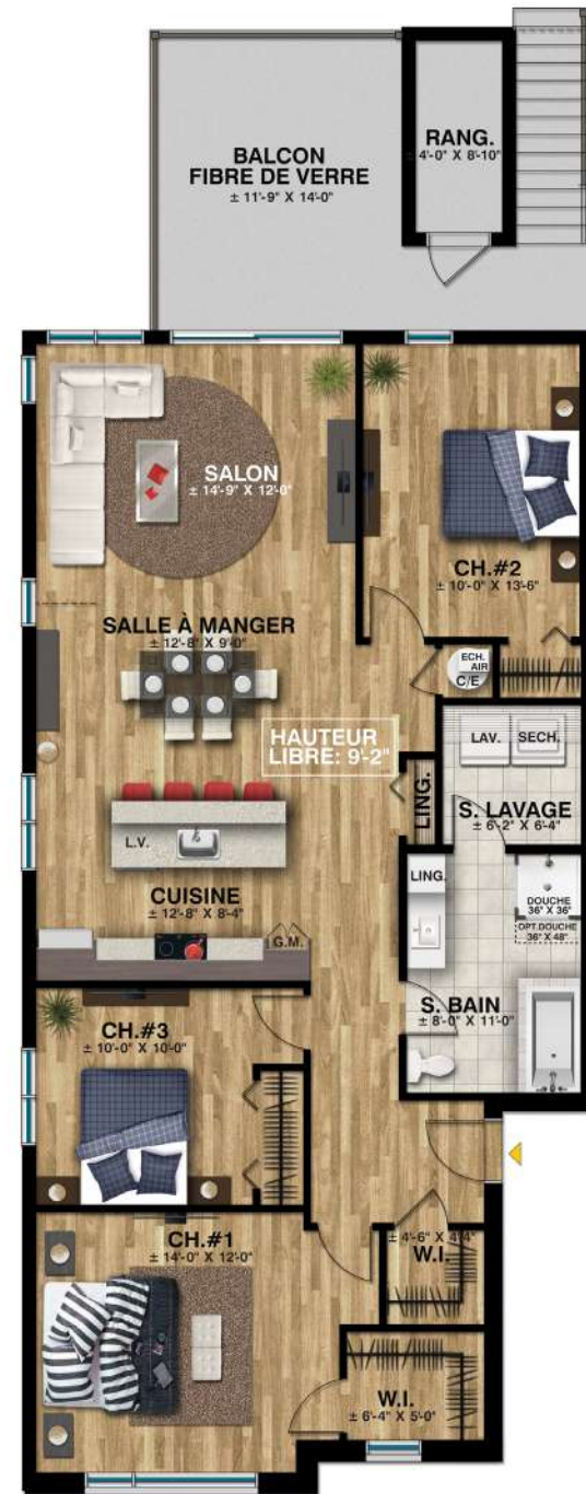
Logement 2 et 4